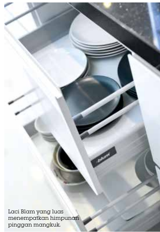
Laci Blam yang luas menempatkan himpunan pinggan mangkuk.