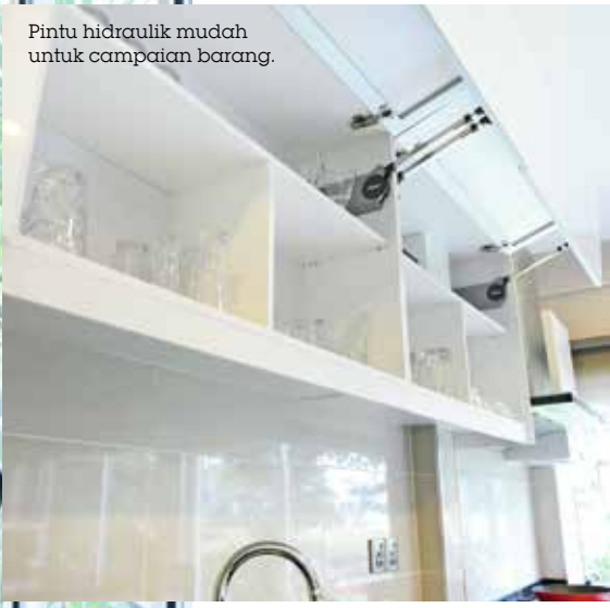
Pintu hidraulik mudah untuk campaian barang.