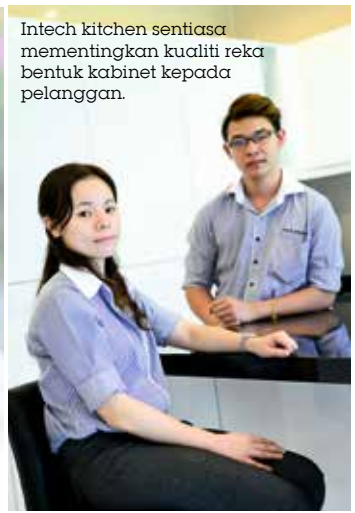
Intech kitchen sentiasa mementingkan kualiti reka bentuk kabinet kepada pelanggan.