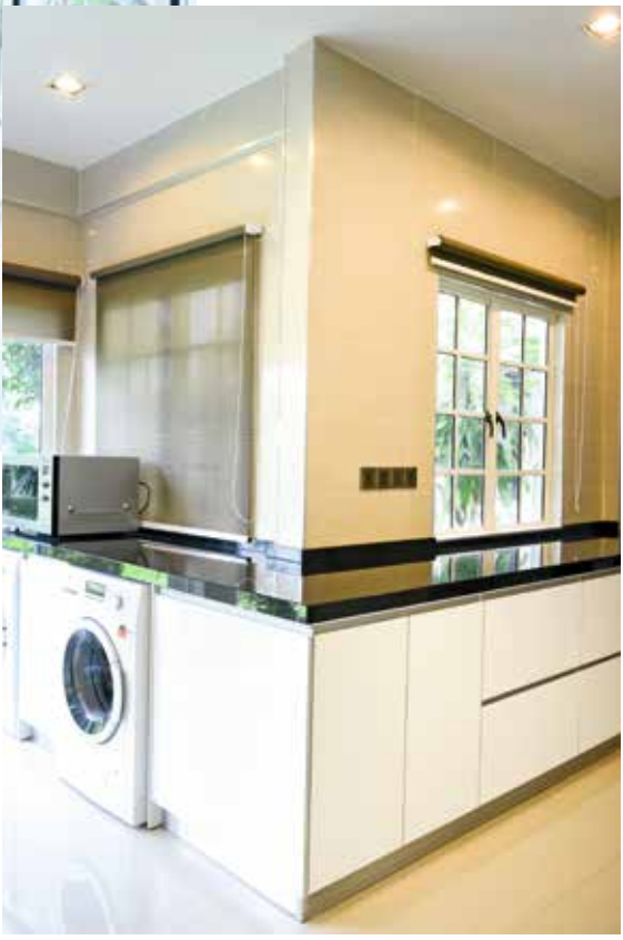
KIRI Ruang membasuh diwujudkan bersekali dengan ruang dapur untuk kemudahan pemilik.