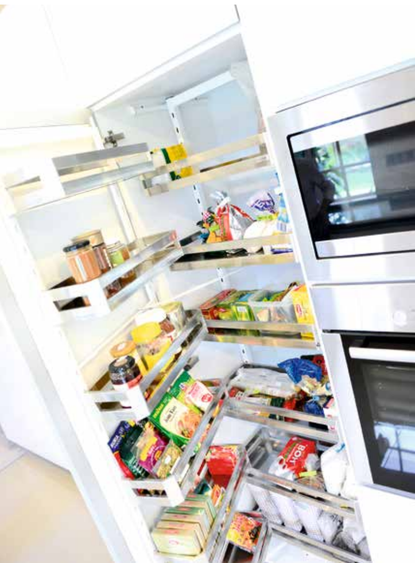
ATAS Tall larder berfungsi hebat untuk menempatkan stok makanan kering. KANAN Tergambar kegembiraan di wajah pemilik setelah memiliki dapur idaman.

Dalam mereka bentuk dapur pemilik, keperluan penstoran amat diutamakan sebagaimana kehendak pemilik. Ruang penstoran sengaja dihadirkan dalam ruang yang besar bagi memuatkan segala alatan kelengkapan dapur. Laci dapur ini mampu memuatkan barang seberat 15 kilogram. Ia juga dilengkapi dengan sistem aksesori seperti soft close yang berfungsi senyap. Selain itu dapur ini turut dilengkapi aksesori yang efisien antaranya tall larder , push up button , bottle basket dan pull out basket . Istimewanya juga ruang membasuh pakaian dibina bersekali di ruang dapur kerana menurut pemilik mudah baginya melakukan kerja membasuh di ruang yang sama serta praktikal. Secara keseluruhannya reka bentuk dapur ini memberikan kesempurnaan kepada pemilik dalam melakukan aktiviti rutin di ruang dapur.